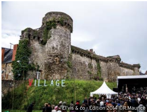
El'vis & co - Édition 2014

- À quoi peut-on s'attendre ? Le collectif El'vis & co nous propose une immersion sous-marine dans ce satellite qu'est le village, un sas de décompression, avant de pénétrer dans l'enceinte du festival.