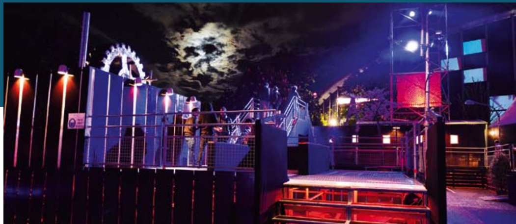
Grand Géant - Édition 2013