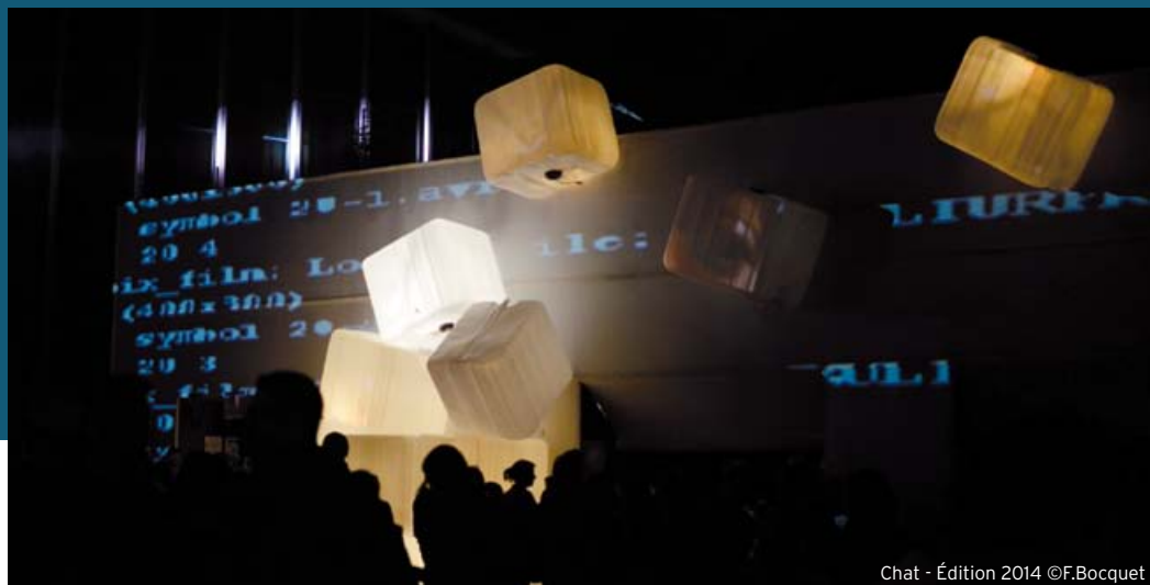
Chat - Édition 2014