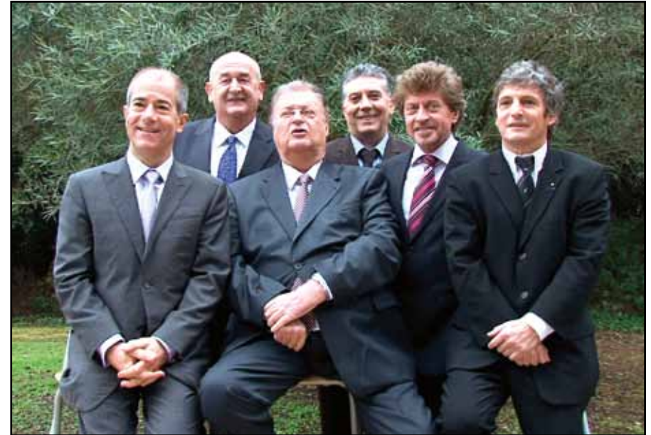
LE PRÉSIDENT ET SES CINQ TÊTES DE LISTES DÉPARTEMENTALES